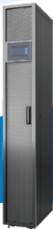
ENFRIADOR EN HILERAS SRCOOLDRXW - 25