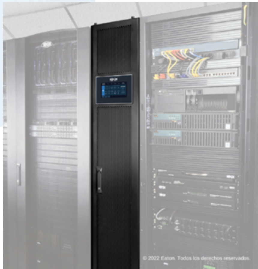
ENFRIADOR EN HILERAS SRCOOLDRXW - 25

La compañía estadounidense sorprende con nuevos equipamientos que permiten la refrigeración inteligente de espacios TI, y ello gracias a innovaciones que posibilitan un significativo ahorro de energía, un control operativo remoto y escalabilidad.