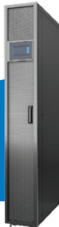
ENFRIADOR EN HILERAS SRCOOLDRXW - 12